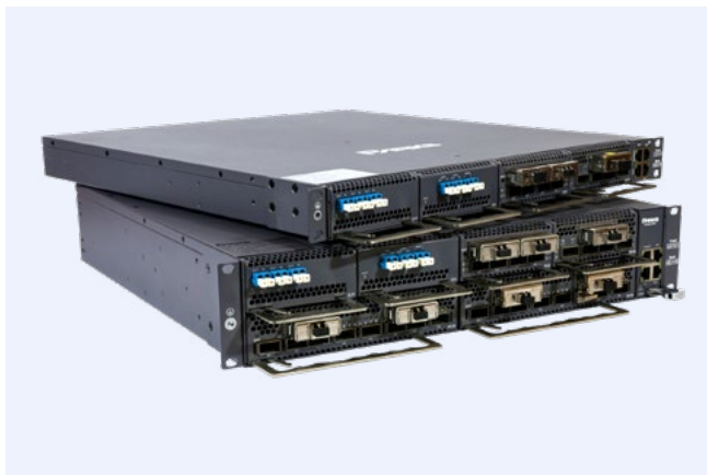
DWDM / DCI